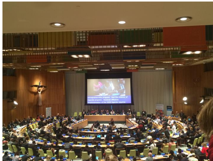
View of the Trusteeship Council during FPAN session